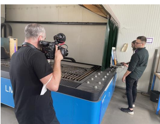
Tour of the production premises of COLAB, a.s.