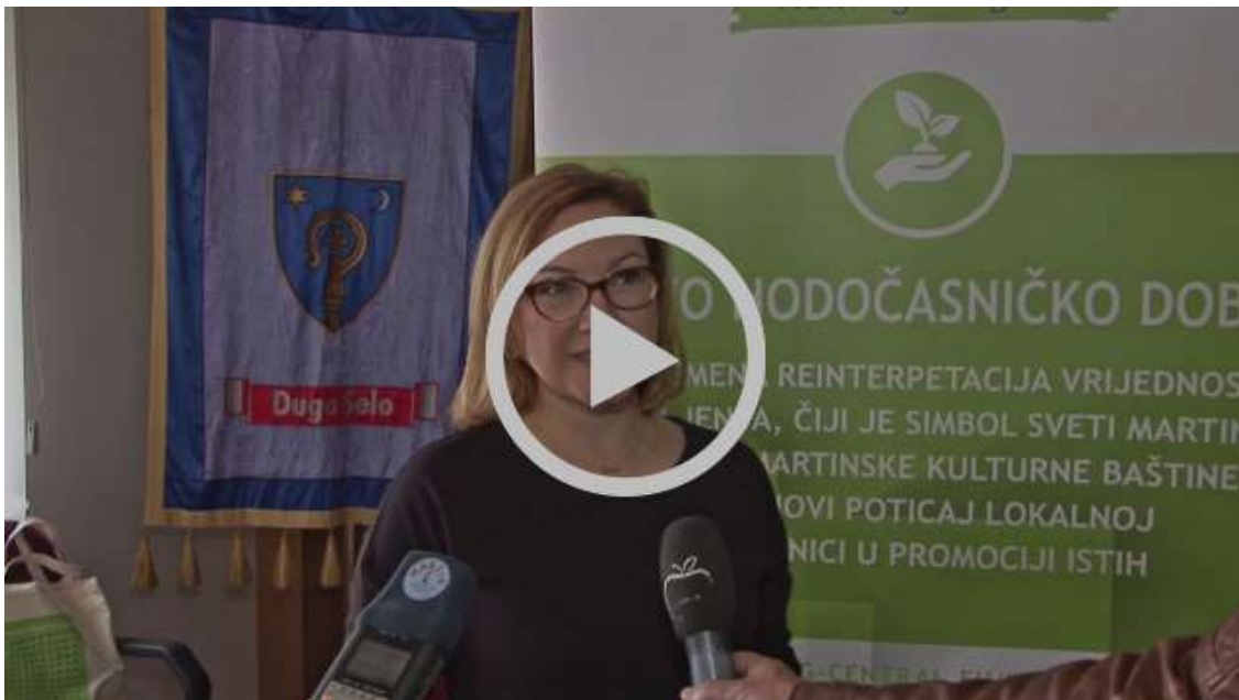
Župan Dugega Sela je nagradil ustvarjalce najboljših idej o dediščini sv. Martina, ki so sodelovali na javnem natečaju. Oglejte si video posnetek intervjujev z zmagovalci..