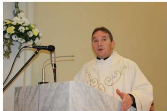
Fotografije iz Parade sv. Martina v Dugem Selu, Hrvaška.