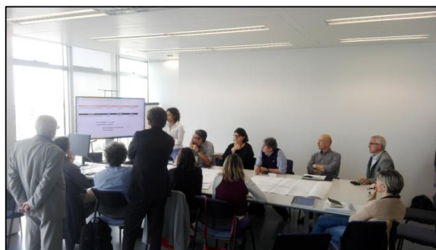
FQP di Bologna: lavori in corso