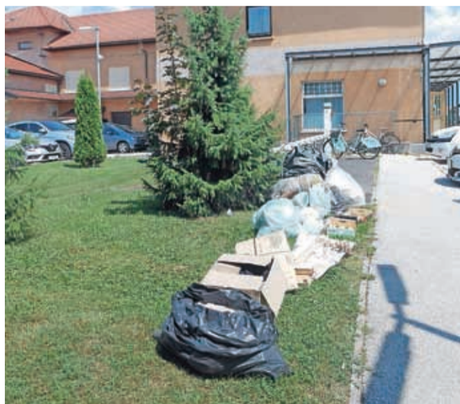
Kupi smeti in odpadkov na Primskovem, na katere je v avgustu opozoril uporabnik družbenega omrežja Facebook

občinski inšpektorat Kranj (MIK) opravlja tudi preglede na podlagi prejetih prijav. Primer s Primskovega,